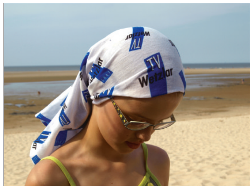
Der Turnverein Wetzlar ist auch Urlaub dabei.

❖ Die Sportler, Jugendlichen, Eltern, Übungsleiter und Helfer auffordern, Fotos zu machen und Erlebnisberichte zu schreiben